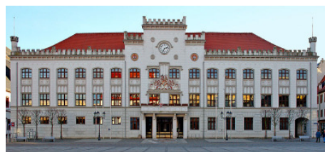
der Sitz des zukünftigen OB