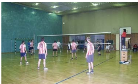
viele heiße Duelle wurden gespielt

Plätze eins bis vier im kleinen und großen Finale ausgespielt. Der erste Preis, verbunden mit einem Wanderpokal, ging an den SV Anthonstal. Auf dem zweiten Platz folgte das Team des Käthe-Kollwitz-Gymnasiums. Im kleinen Finale ging als Sieger das Team Nawrath hervor und belegte somit den dritten Platz, Viertplatziertes war das Team „DDJS“. Nach einem erfolgreichen Turnier freuen wir uns auf das nächste Jahr und hoffen, dass auch die rege Beteiligung wieder zu Stande kommen wird.