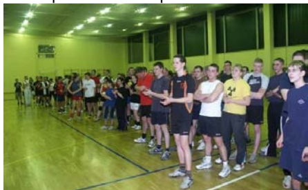
14 Mannschaften traten zum Turnier an