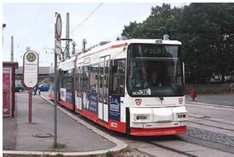
die Fahrgäste sind die Leidtragenden

Der Tag der offiziellen Übernahme – 1. Januar 2008 – war noch nicht erreicht, da wurde auch schon an der „neuen Beförderungsqualität“ gearbeitet. Kleinere Fahrzeugeinheiten in den Hauptverkehrszeiten führten zu überfüllten Straßenbahnen und unweigerlich zu langen Wartezeiten an den Haltestellen. Nach vielen Beschwerden, die teilweise die Telefonanschlüsse des SVZ-Kundenbüros lahmlegten, wurde lapidar auf „technische Schwierigkeiten“ verwiesen.